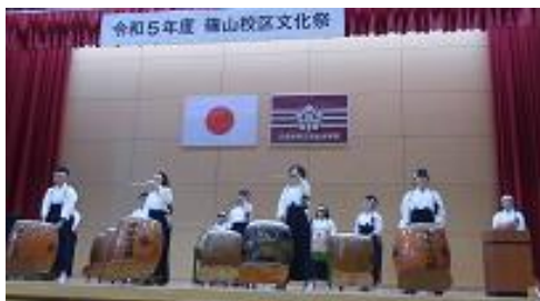
有馬押し太鼓クラブが力強い演奏をしました