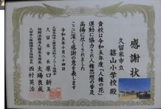
らいねんじんけん 来年人権