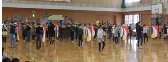
伝統を引き継ぎマーチングを披露する5年生