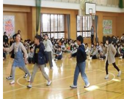
応援団になりきった3年生