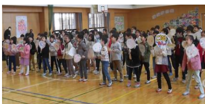
6年生の名前をかいたうちわをもって歌う1年生