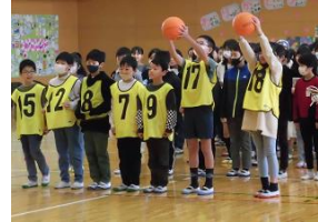
クラブ活動のお礼を言う4年生