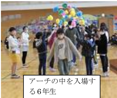
アーチの中を入場する6年生

全校みなでお世話になった6年生へ「ありがとう」を伝える「6年生を送る会」が1日行われました。入場では一人一人の名前が呼ばれちょっと照れながらパフォーマンスをする6年生の姿がほほえましかったです。各学年からは思いのこもった出し物ばかりでした。6年生からも各学年へのお礼の気持ちとプレゼントが届けられました。先生たちのサプライズもあり会場中が笑いとお温かさに包まれていました。新児童会長へのバトンも引き継がれ、5年生も最上級生となる心構えをもち、気が引き締まったと思います。全校で歌う最後の校歌の歌声に感動し、「校長先生のお話」と言われても言葉がつかまって話ができませんでした。素晴らしい篠山小学校の子どもたちです。心配された天気も持ち直し、お別れ遠足も楽しむことができました。6年生だけでなく全校のみなで思い出ができました。