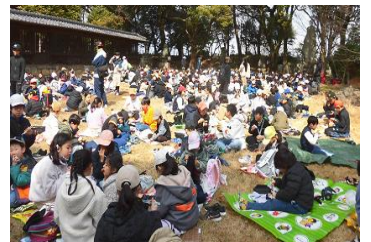
お別れ遠足も楽しみました。