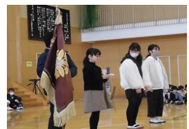
児童会長・副会長の引継ぎ