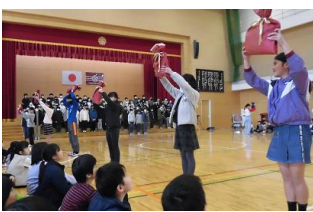
各学年毎にお礼の言葉を述べていく6年生。各教室で使う雑巾と給食台カバーを家庭科の時間を使って作り上げ、全学級にプレゼントしてくれました。素敵な6年生です。ありがとう