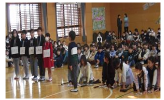
縦割り掃除のお礼を伝える2年生